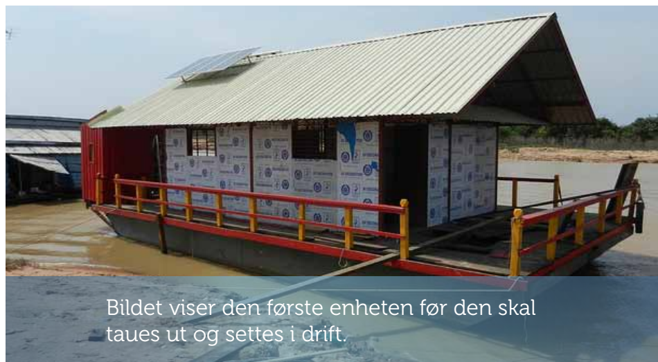
Bildet viser den første enheten før den skal taues ut og settes i drift.